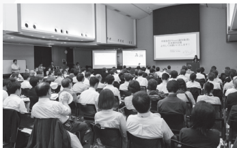
*写真は第10回、三鷹産業プラザでの模様です。